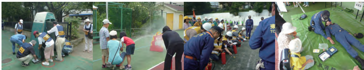
各写真はイメージです。当日の会場は屋内です。